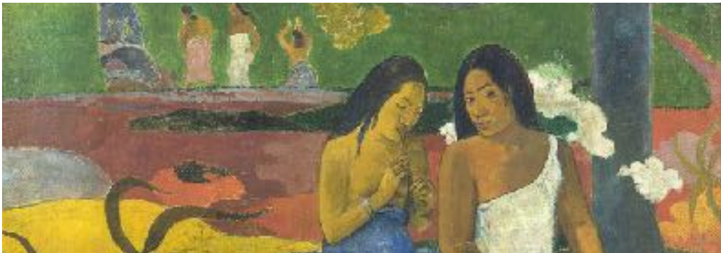
Quelle: Paul Gauguin, Arearea