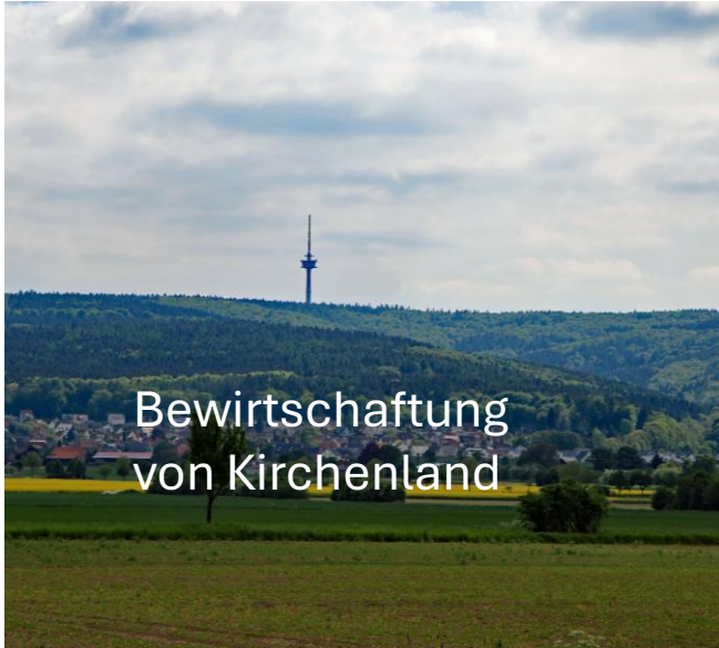
Bewirtschaftung von Kirchenland