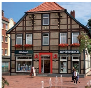
seit über 200 Jahren!